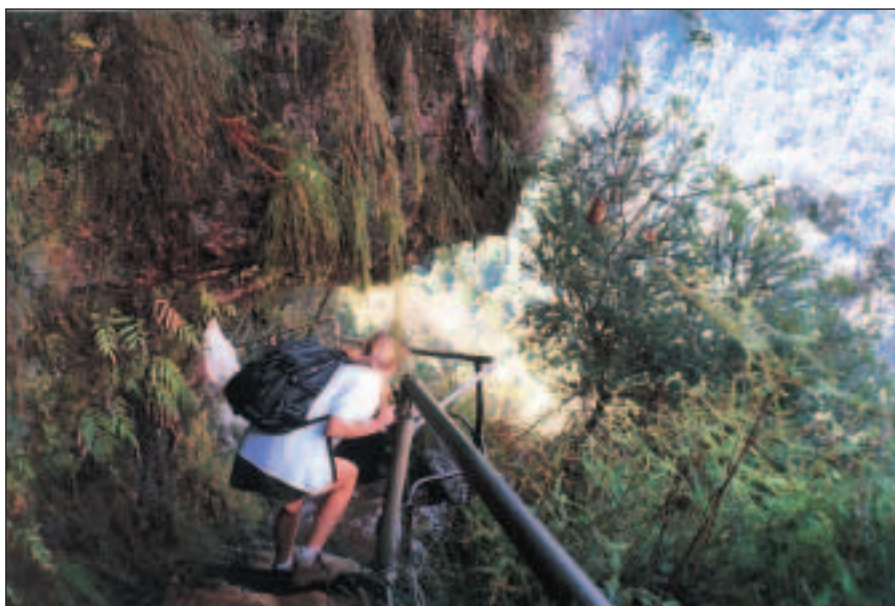
Pak jdeme dolů cestou vybudovanou ve stěně vedle vodopádu.