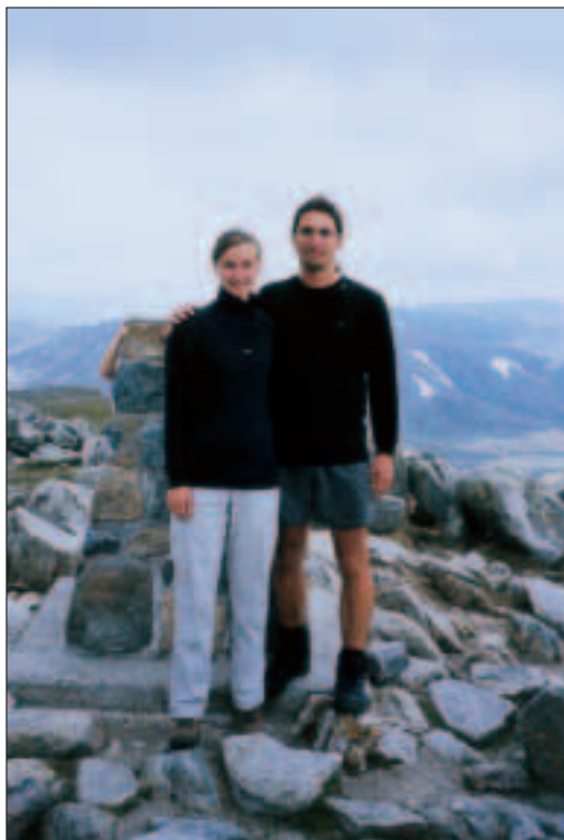
Na vrcholu Kosciuszka, 2228 metrů.

vítá sluníčko, mraky se většinou válejí v údolí pod námi, i když nad hlavou jich stále pár zůstává. Jdeme tedy na Kosciuszko. Cesta vede po kovové mřížové konstrukci, něco takového jsme ještě neviděli, je to učiněná dálnice pro pěší. Díky tomuto upravenému povrchu a hordám obrovských kousavých much postupujeme velmi rychle – asi 6 km/h. Takhle lehce jsme si výstup na nejvyšší horu kontinentu nepředstavovali. V půlce cesty jsou záchody a musíme uznat, že to není špatný nápad, turistů je tu přehršel.