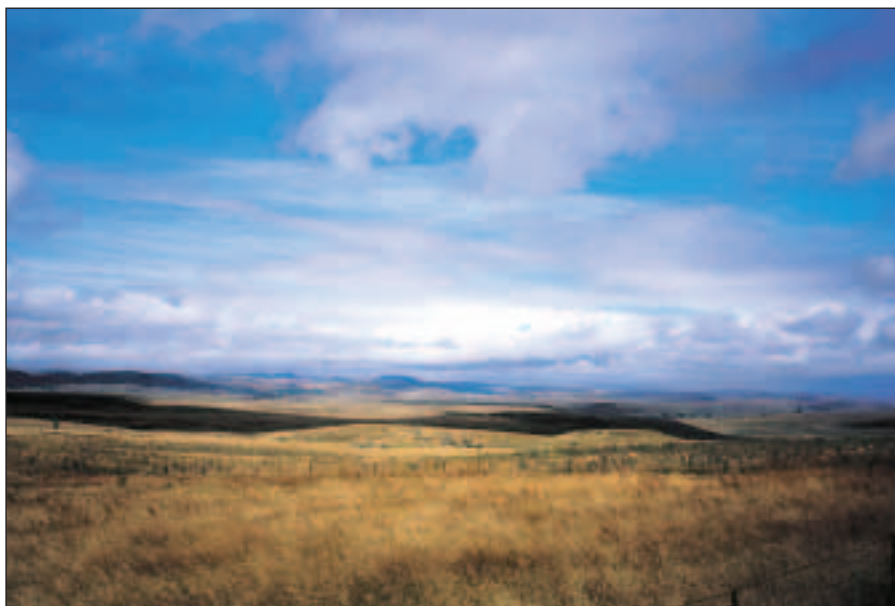
Krajina se po opuštění horských oblastí rychle mění.

Druhý den brzy ráno autem stoupáme na Charlotte Pass, odkud vedou cesty na Kosciuszko, Blue Lake apod. A nemusí se platit lanovka. Silnici tu už máme projetou, protože jsme sem předevečirem zabloudili. Nahoře nás vítá nevlídné mlhavé počasí. To nás těší, protože můžeme užít i to oblečení, o kterém jsme si mysleli, že ho táhneme zbytečně. A také ve všech průvodcích psali, že tu i uprostřed léta může být hnusně a tak máme radost, že nelžou. Po chvilce přemlouvání se navlečení do šustáku a moiry vydáváme na 10 km procházku na Blue Lake. Hned po úvodním sestupu překonáváme po kamenech známou Snowy River (Sněžná řeka, hrála ve filmu Muž od Sněžné řeky). Když jsme se mlhou a deštěm dotrmáceli k jezeru, byli jsme přírodou odměněni asi dvacetisekundovým okamžikem, kdy se z ničeho nic vyjasnilo a my jsme si mohli prohlédnout a vyfotit okolí. Pak zase mlha klesla. Během návratu se mraky ještě několikrát protrhaly a odhalily nám části výhledů, ale evidentně jen proto, abychom mohli závidět těm, kteří se sem vydají za příznivějšího počasí. Ještě obdivujeme rozmanitou horskou květenu a moc nám líbí Snow Gum – druh eukalyptu, který roste na horách. Jeho typická sloupaná kůra je až třibarevná. Les tak hraje barvami, což je pro nás nevšední podívaná. Ze Snowy River lovíme kamínky na památku.