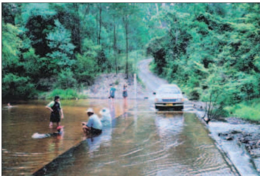
U kempu Wheeny Creek