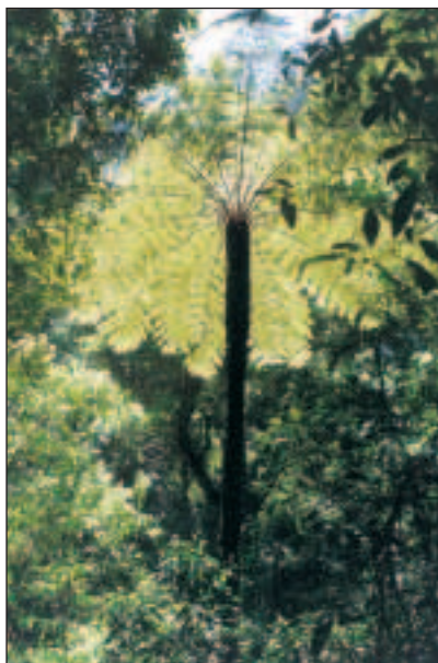
Tuto nádhernou palmu jsme potkali cestou.