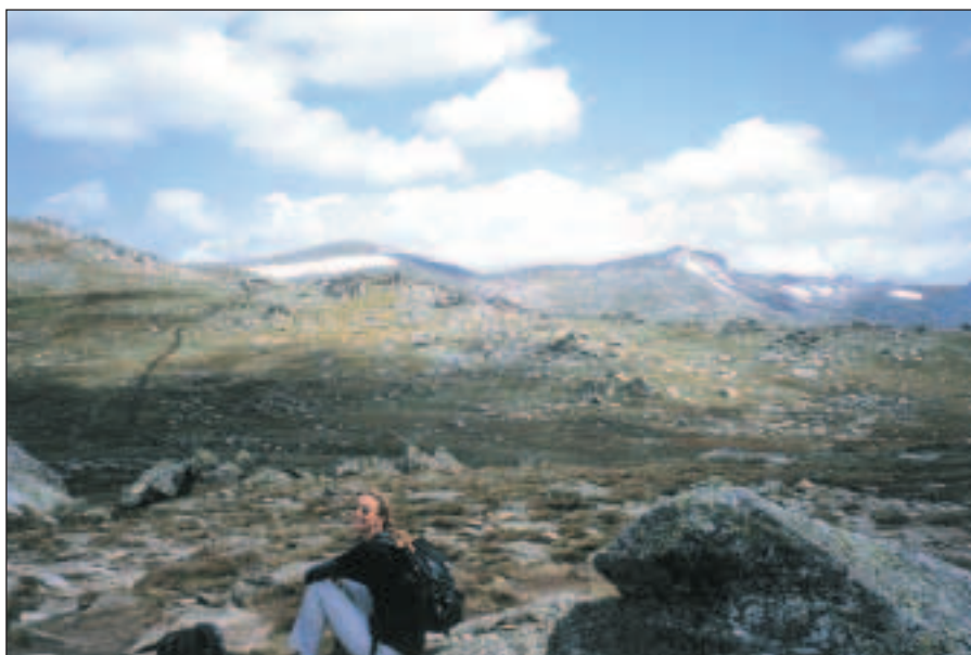
Všimněte si dálnice vedoucí na nejvyšší horu Austrálie.