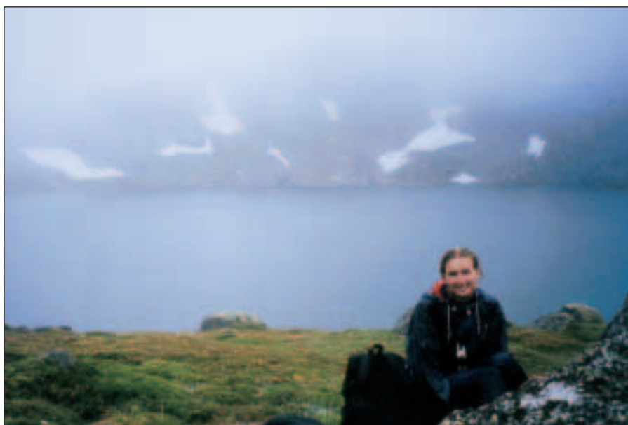
Blue Lake. Zima a mlha bohužel výrazně kazí celkový dojem.