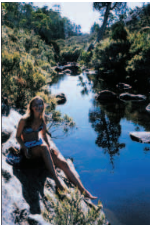
Voda je překvapivě teploučká.

ří jdou vaším směrem a zároveň s těmi, co jdou v protisměru. Uděláte si přátele a zároveň se žádný večer nenudíte, protože poznáváte nové lidi. Pořád je co povídat o sobě a pořád je tu někdo nový, kdo vám poví zajímavý životní příběh a nové vtípky.