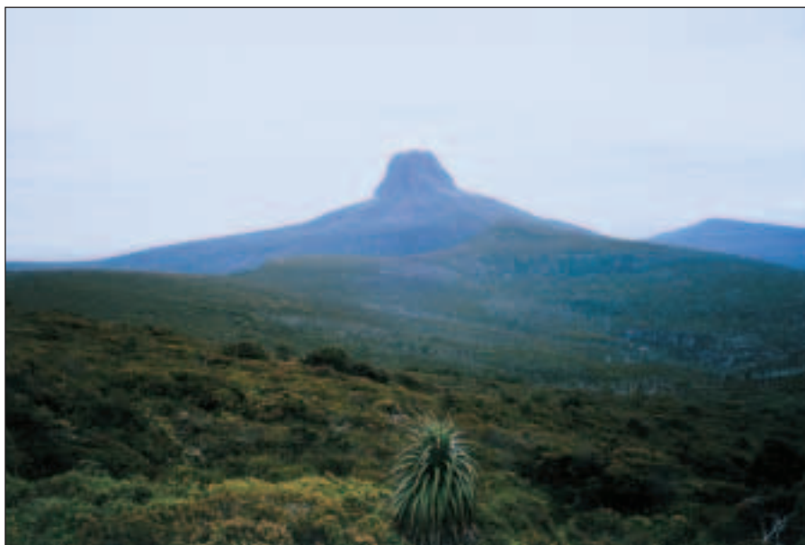
V dálce se tyčí Mt. Bluff.