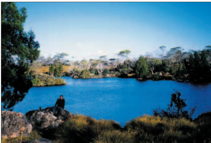
Takhle jezero Windermere vypadá, když na něj zasvítí pozdně-odpolední sluníčko...