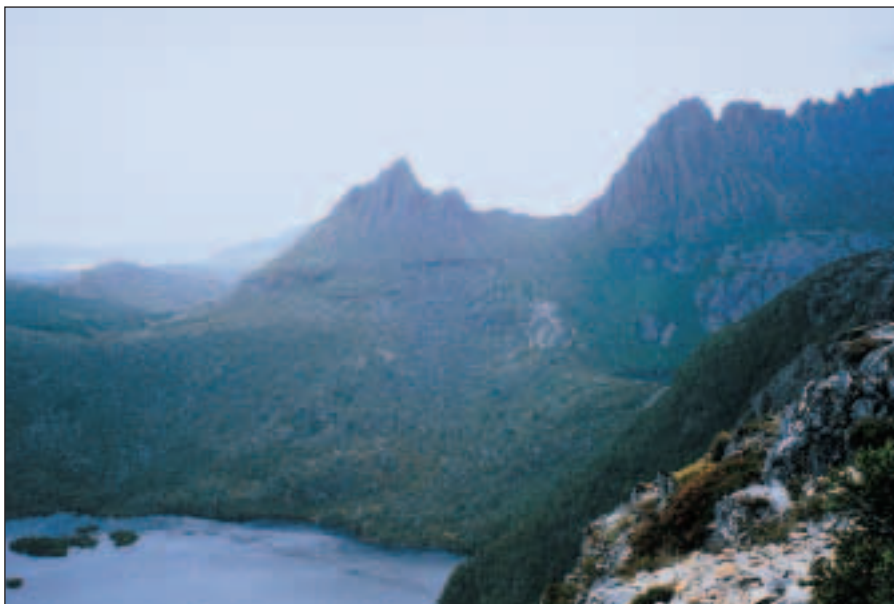
Jedna z ikon Tasmánie: Cradle Mountain.

Protože se nacházíme již hodně na jihu, teploty jsou tu o mnoho nižší, zejména na horách je nutné být připraven na nenadálou sněhovou bouři kdykoli během roku.