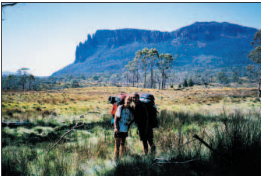
Jsmo jen kousek od tábora a koupele v tůňce...