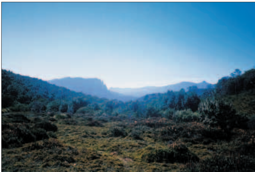
Procházíme krásnou krajinou, v dálce se tyčí rozeklané stěny.