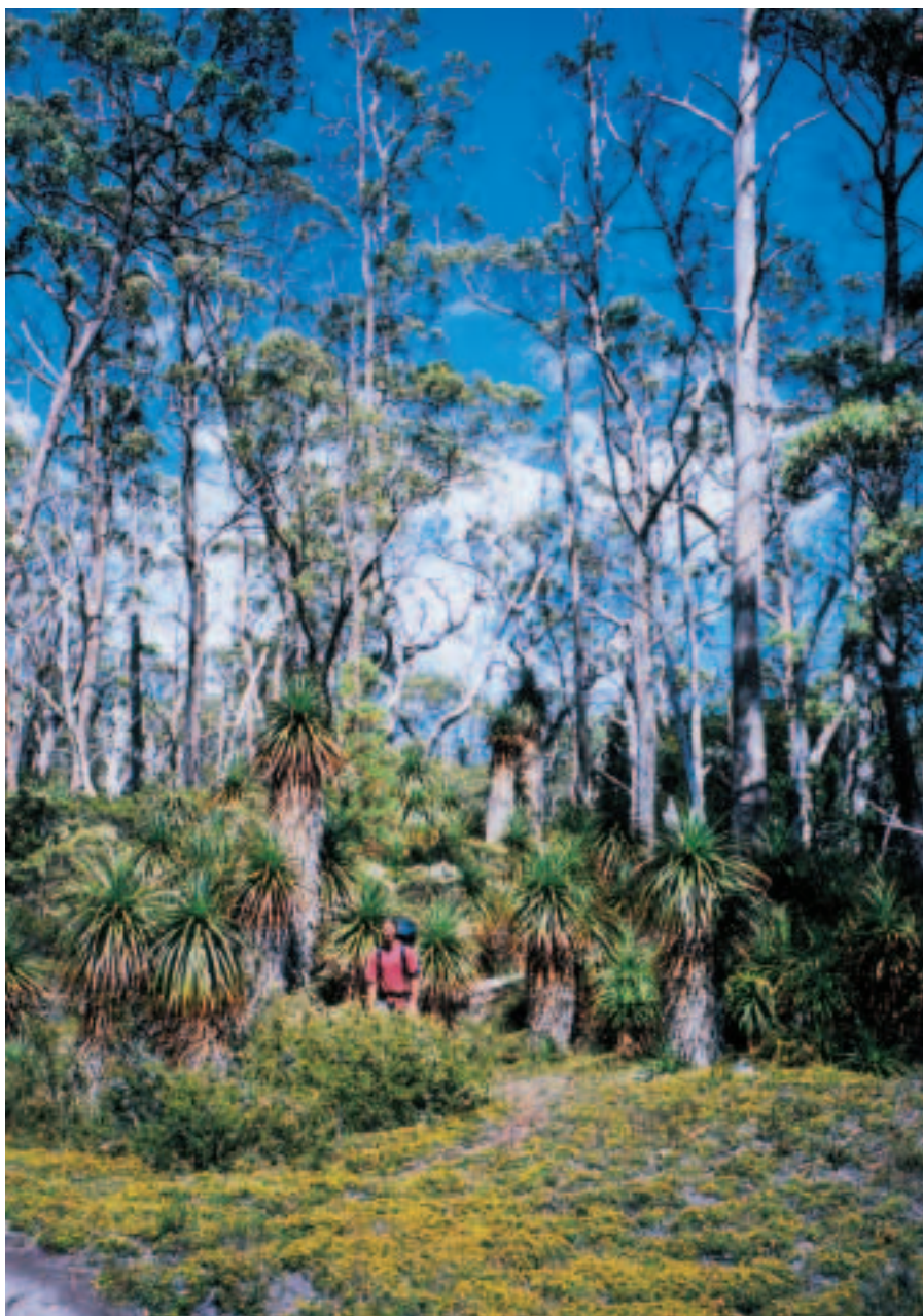
Obklopen Richeami, připadám si jako v botanické zahradě.