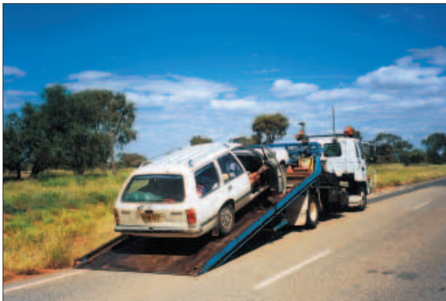
Náš nemocný Holden.

Slunce máme v zádech, obloha je posytá mráčky, vegetace okolo je jasně zelená, jasně červené hory vystupují proti nám. Využíváme ideální podmínky na focení a výsledky nás později příjemně překvapí.