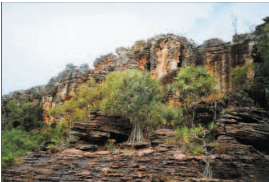
Stoupáme na Escarpment.

Vstupenka je platná 14 dní a uvnitř parku je mnoho kempů se základním vybavením, kde lze kempovat bez dalšího poplatku. Samozřejmě, pro pohodlnější turisty jsou zde i plně vybavené resorty a komerční kempy. Návštěvníků sem ročně přijede na 200 000, z toho naprostá většina v období sucha, ale ty, kteří jsou ochotní poprat se s vedrem a vlhkem, zde čekají atrakce parku v plné síle. Takových lidí v posledních letech stále přibývá. Nutno ovšem upozornit, že některé cesty mohou být v období dešťů uzavřené.