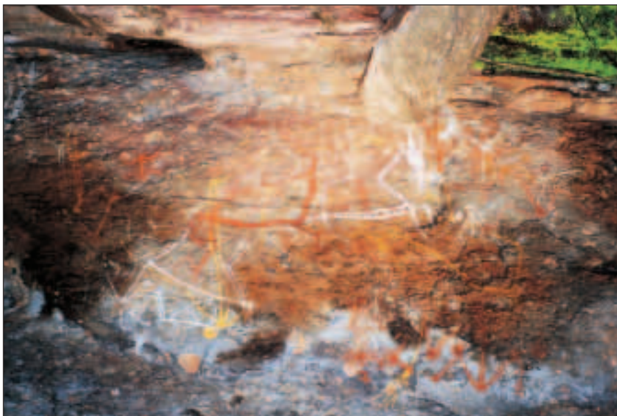
Aboriginské umění na skalních stěnách.

Překvapilo nás, kolik jich v té řece je. Nikdy jsme varování před krokodýly nebrali na lehkou váhu a po tomto zážitku už něco takového nehrozí.