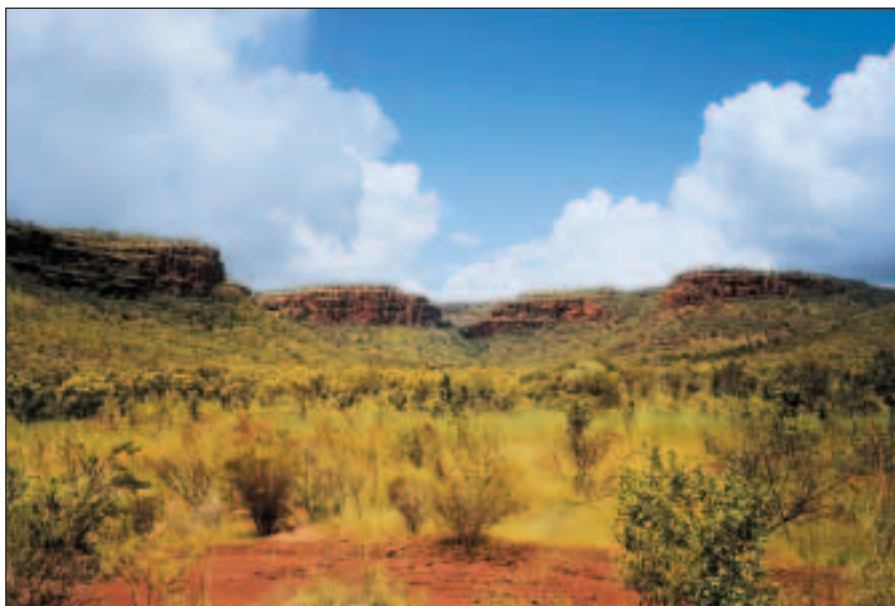
Joe Creek Walk.