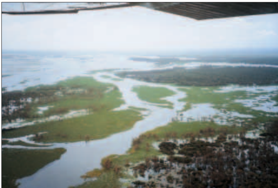
Zatopený Kakadu N. P.

Dole nás zase čeká les po nedávném požáru. Několikrát se ztrácíme a zase nacházíme. Voda padající shora mění tuto pláň v rybník a nám nezbývá než pokračovat téměř po kolena ve vodě. Cestou je ještě jeden Art-site. Nabízí nejlepší domorodé kresby, jaké jsme měli možnost pozorovat. Konečně vypadá mnohem lépe než na fotografiích. Výkladové cedule osvětlí význam jednotlivých kreseb. Bohužel s udáváním věku maleb a rytin do skály je (jako všude) problém a tak se omezují na obecné údaje, jako že jsou 200 – 20000 let staré. Z nějakého důvodu totiž nejde zjistit přesné stáří maleb. Zajímavé například je, že vedle dokonalých kreseb, které jsou označovány za starobylé se nachází dětské malůvky plachetnice. V dobách, kdy se tyto památky ještě přísně nestřežily, si zde mohl kdekdo přimalovat, co ho napadlo.