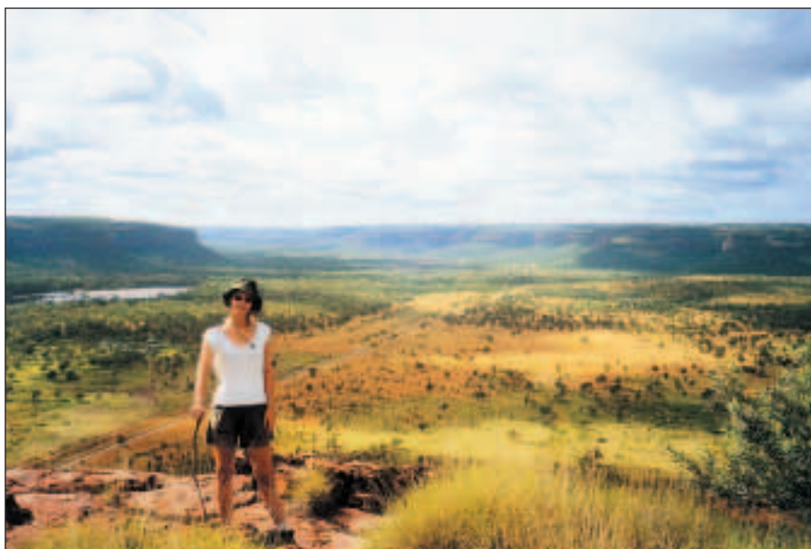
Rozsáhlé údolí řeky Victoria.