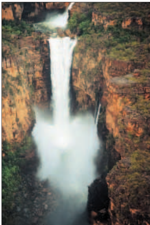
Jim Jim Falls

Stejně jsme promočení potem a tak pokračujeme i za deště. Nutno poznamenat, že dešť, ten taďy tedy umění. Scházíme dolů z útesu, cesta je velmi kluzká a z části vede potokem. Stačí malé zaváhání a Lenka sedí v potoce, zadní část těla má naraženou o kámen.