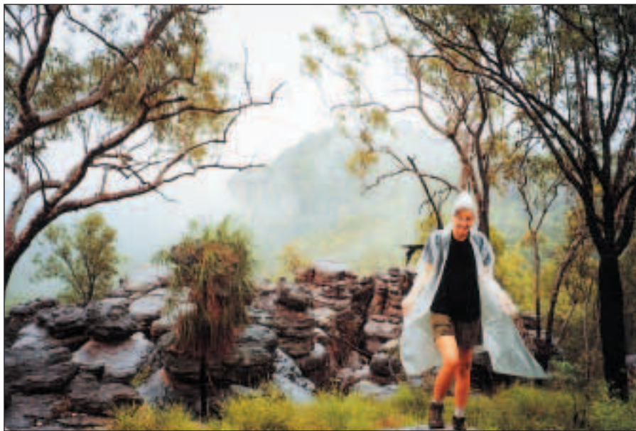
Ani v dešti nás dobrá nálada neopouští.

Nutno ještě upozornit na krokouše: jsou všude.