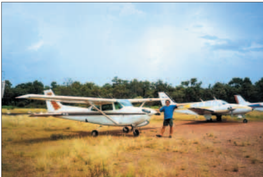
Tímto letadélkem jsme se nad Kakadu proháněli.