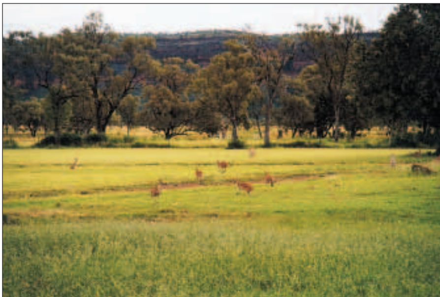
Studie klokanů v pohybu.

Začali jsme nádherným Escarpment Walk, který stál i za panoramatickou fotku. Tato procházka začíná z parkoviště asi 2 km za Victoria River Roadhouse, pokračuje strmě vzhůru a pak po okraji útesu, odkud máte možnost pozorovat široké údolí pod sebou.