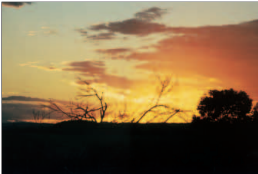
Když slunko zapadá...

Art Gallery nás hodně zklamala. Ač všude vyzdvihovaná jako úžasná ukázka domorodých skalních kreseb, je to spíše fraška. Nachází se zde několik obtisků rukou. Cedule upozorňují, že zde poprvé byl použit motiv několik obtisků (nebo, lépe, „obprsků“) spojených do sebe. Dále je tu pár čar, jako by se někdo připravoval na hraní oblíbené hry „lodě“. Pak následuje celá dlouhatánská stěna bohatě vyzdobená stovkami vyrytých vagin všech možných i nemožných velikostí. Děláme si legraci, že šlo zřejmě o sčítání žen. K těmto vaginám je zde vtipná vědecká popiska, která praví, že