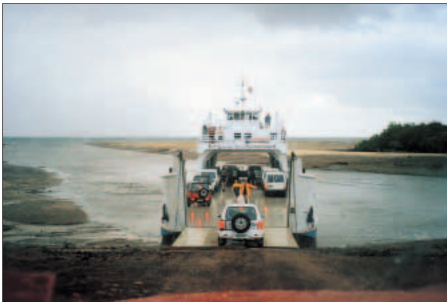
Trajekt z Fraser Island.

jsme najeli na nafoukaný písek, který prostě není vidět. Zrovna tak přejíždění potůčků je pro nás řidičská lahůdka. Moc nás to baví.