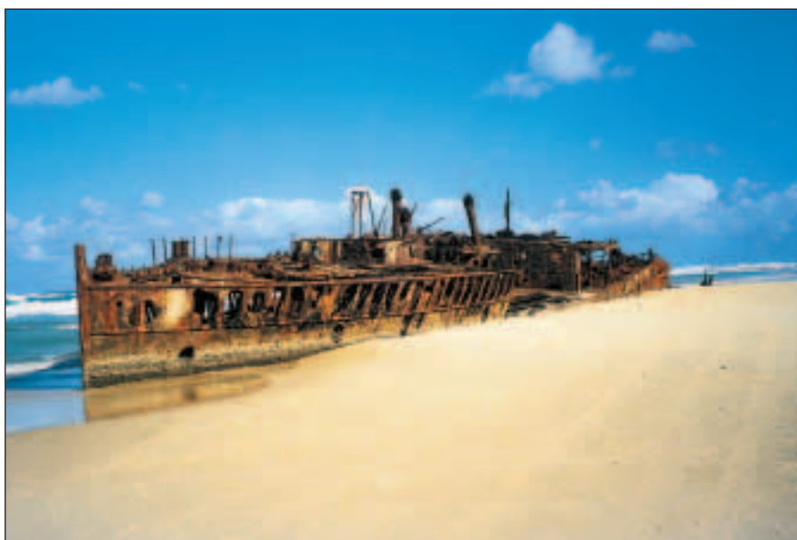
Vrak lodi Maheno.