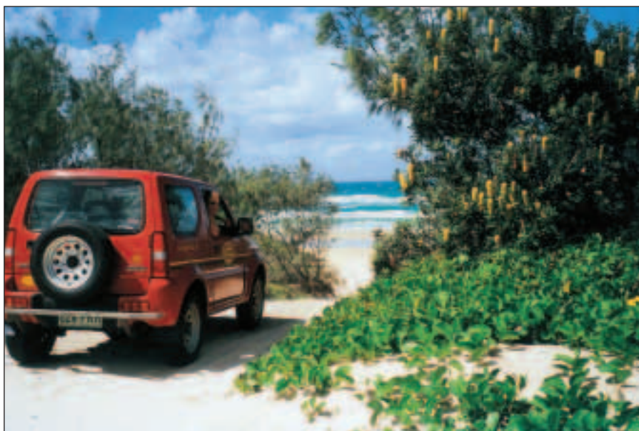
Sjezd na pláž.