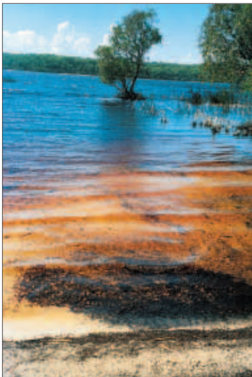
Zbarvené vody jezera Boomanjin

Nyní zpět k současnosti: na ostrov se lze dostat pouze s 4WD. Skrz ostrov vede mnoho písčinyých cest, hlavní komunikace pak je přes 100 km dlouhá východní pláž. Platí zde pravidla jako na silnici, s tím rozdílem, že můžete jezdit i vpravo. Dvě míjící auta si dávají znamení pomocí blinkrů, aby bylo jasné, kudy se chtějí minout. Maximální rychlost je omezena na 80 km/h (na spojovacích cestách přes ostrov je to 35 km/h). Obě maximální rychlosti však dosáhnete zřídka, terén ostrova je velmi členitý a na pláži je třeba dát pozor na potoky, které odvádějí dešťovou vodu do moře a na neviditelné hupy. Jezdění po pláži je rovněž omezeno přílivem. V každé půjčovně Vám přesně řeknou, kdy nastává a protože jízda slanou vodou je považována za prohřešek, který může stát mnoho peněz, je rozumné se dvě hodiny před a po přílivu držet mimo pláž. Protože je návštěva Fraser Islandu považována téměř za povinnost, panuje zde čilý pro-