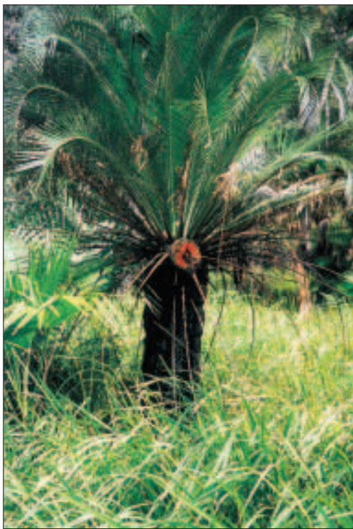
Červená barva ořechu varuje před konzumací. Ořech obsahuje nebezpečně toxické látky.

Projíždíme opět nádhernou krajinou, všude rostou Bottle Trees a když si konečně najdeme při úžasném západu slunce místo na přespání u městečka Monto, dokonce si pod jedním stavíme stan. Je nám teď trochu líto, že jsme kvůli tomu, že jsme chtěli vidět baobaby, ztratili pět dní u řeky, ale to je život, a s odstupem času nakonec toho zážitku nelitujeme, i když nám způsobil časový pres v závěru cestování. Později jsme se dověděli, že Queensland bottle trees nejsou blízcí příbuzní se západoaustralskými baobaby. Oba stromy jsou si velmi podobné a oba mají v rozšířených kmenech houbovitou hmotu, která zadržuje vodu. Mají však jiné listy. Queensland bottle trees jsou již odvěkými obyvateli Austrálie, zatímco baobaby, jejichž příbuzní se nacházejí pouze v Africe, jsou pravděpodobně na tomto kontinentu relativně nedávnými přistěhovalci, neboť je prokázáno, že stále pokračuje jejich expanze ze západu na východ.