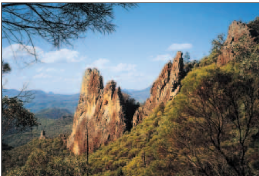
Náš poslední park...