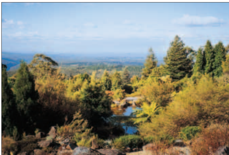
Botanická zahrada na Mt Tomah