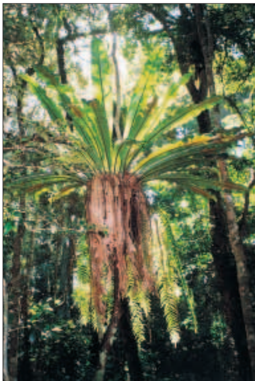
Příživníkům se v deštném pralese daří.

snad 100 km. Je vidět, že se dostáváme do civilizace a nám se ukazují spíše její nepřijemné stránky: zatímco v poušti nemáte problém, kde zakempovat, zde je vidět výrazný úbytek odpočívadel.