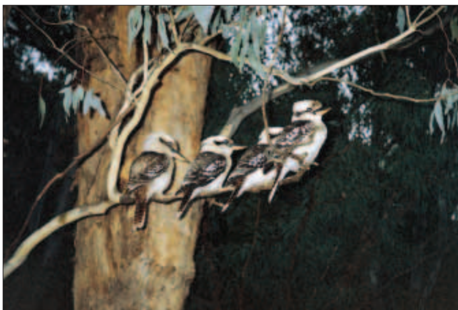
... a kookabury, které se s námi přišly rozloučit.