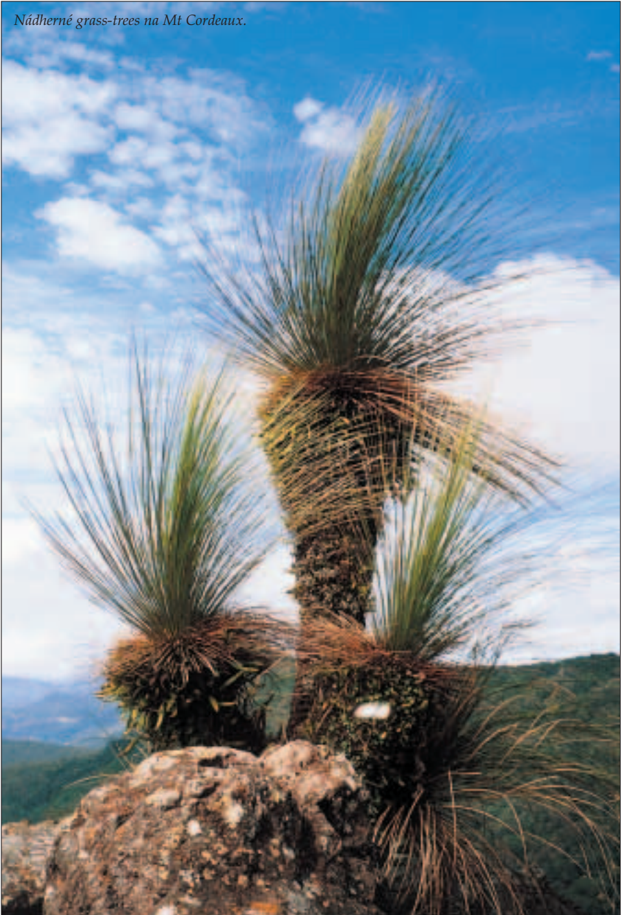
Nádherné grass-trees na Mt Cordeaux.